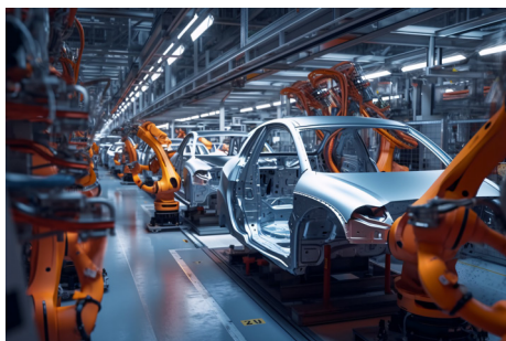
THOST unterstützt große Automobilhersteller dabei, die Fertigung von Elektroautos in ihre bestehende Produktion zu integrieren.

THOST Projektmanagement ist jährlich an durchschnittlich 500 Projekten weltweit beteiligt. Die Kundenbasis des Familienunternehmens ist breit und umfasst sowohl mehr als die Hälfte der DAX-Konzerne als auch lokale Akteure wie beispielsweise die Städte Karlsruhe und Rheinstetten, die Sparkasse Karlsruhe oder die Großraffinerie MiRO. Die langjährige Zusammenarbeit mit vielen renommierten Kund*innen unterstreicht das breite Vertrauen in die Fachkompetenz und Zuverlässigkeit von THOST. So unterstützt der Familienbetrieb beispielsweise große Automobilhersteller dabei, die Fertigung von Elektroautos in ihre bestehende Produktion zu integrieren.