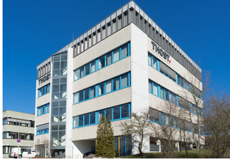
Der Hauptsitz in Pforzheim ist einer von 17 Standorten von THOST in Deutschland.