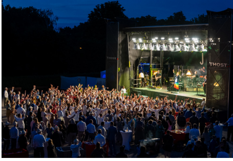
Team-Building als jubelnde Menge: THOST legt großen Wert auf ein echtes WIR-Gefühl und organisiert im Rahmen des Sommerfestes jedes Jahr ein legendäres Fest.