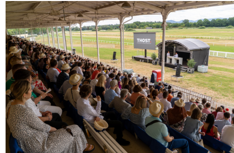
Das Sommerfest als jährlich größte Veranstaltung für alle Mitarbeitenden ermöglicht ein intensives Networking untereinander.

auseigenen Social Intranet sorgt die interne Kommunikation dafür, dass Informationen optimal aufbereitet und jederzeit von allen schnell abrufbar sind. Zudem kommen die Mitarbeitenden jedes Jahr im Rahmen eines beliebten Off-Site-Events zusammen, um sich auszutauschen.