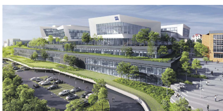
Carl Zeiss in Jena.

Besonders bemerkenswert ist das Großprojekt um den High-Tech-Standort von ZEISS in Jena: Im März 2022 begann die Realisierung des Standortes mit über 100.000 Quadratmetern Brutto-Grundfläche, die sowohl wesentliche Teile der Verwaltung als auch der Forschung und Fertigung des Technologiekonzerns beheimatet. Der Standort ist mit seiner modularen Bauweise und seinem langfristigen Flächenmanagement mit Perspektivflächen auf das Wachstum von ZEISS eingestellt. THOST kommt bei diesem Projekt als Projektsteuerer eine wichtige Rolle zu: Mehr als 50 Unternehmen und ca. 40 Planungsteams müssen gezielt koordiniert werden, um die festgesteckten Ziele hinsichtlich Kosten, Terminen und Qualität einzuhalten. Die Errichtung der ersten Bodenplatte erfolgte im August dieses Jahres, und Betonwände deuten bereits die ersten Gänge und Räume der unteren Sockelgeschosse an. Im Jahr 2026 wird mit dem Umzug in den neuen High-Tech-Standort begonnen.